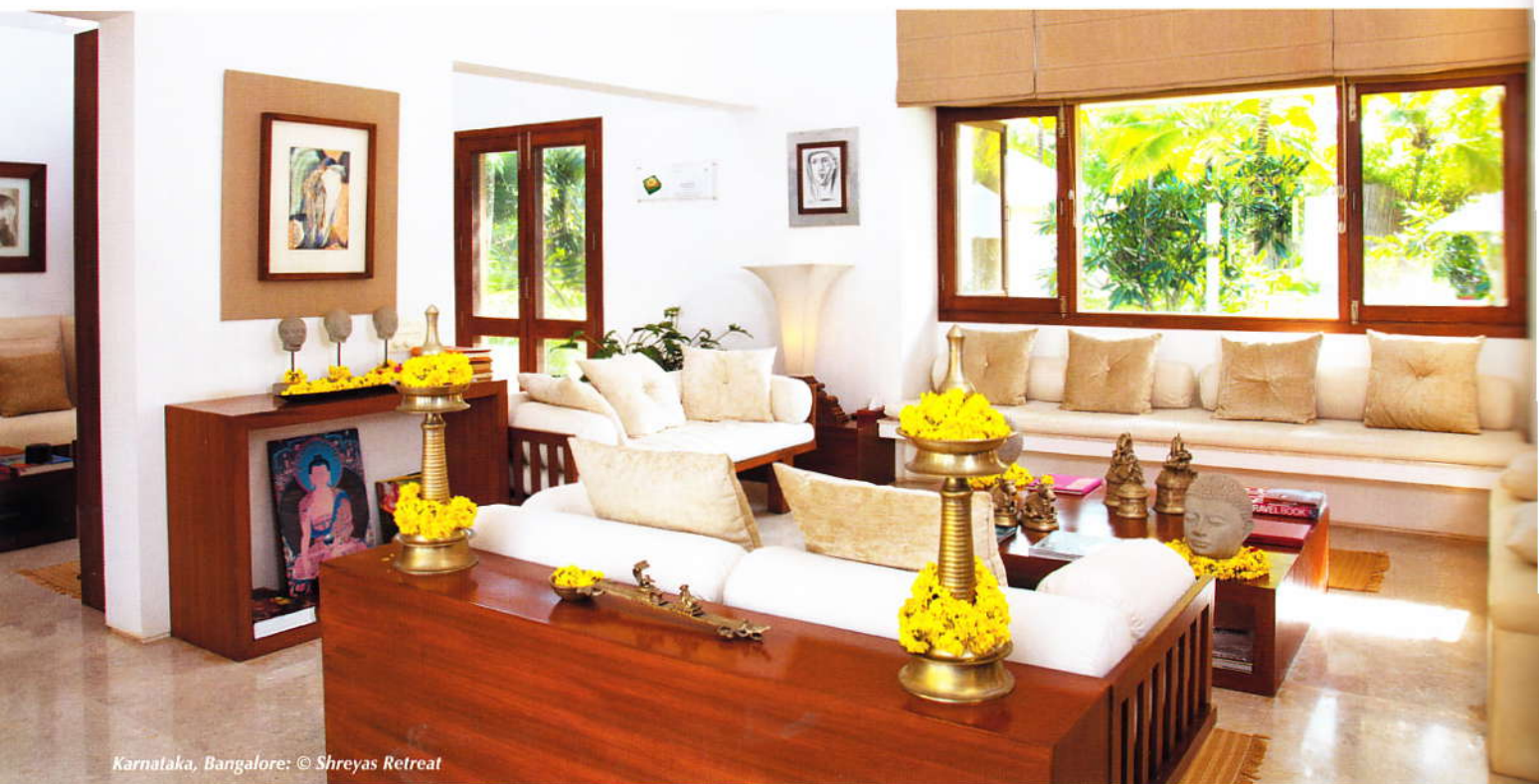
Karnataka, Bangalore: © Shreyas Retreat

VeggieHotels ist die weltweit erste Kooperation für rein vegetarische Hotels und Gästehäuser in über 60 Ländern.